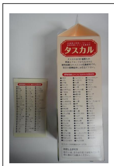
訂正シール添付前