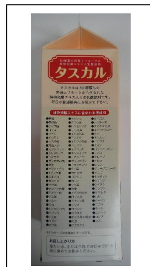
訂正シール添付後